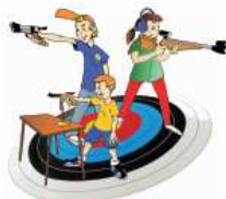
Carabine et Pistolet Ecole de Tir