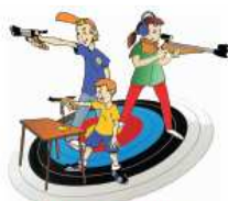
Carabine et Pistolet Ecole de Tir