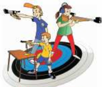
Carabine et Pistolet Ecole de Tir